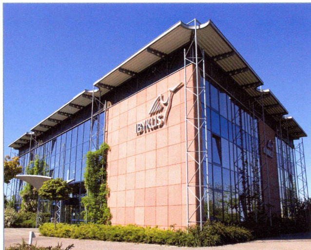
Firmengebäude der IBYKUS AG.