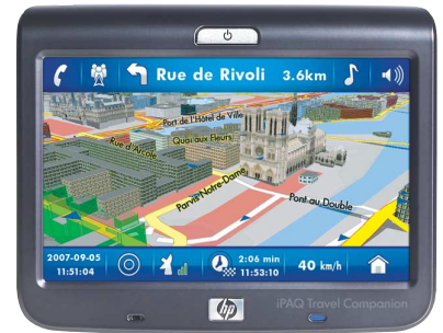
HP iPAQ 314

anbieters und angepasste Geschäftsanwendungen implementiert werden. Den Ideen sind hier fast keine Grenzen gesetzt. Bei der Umsetzung unterstützt HP Services Unternehmen mit zahlreichen Angeboten rund um Integration und Anpassung des HP iPAQ 214 Enterprise Handheld.