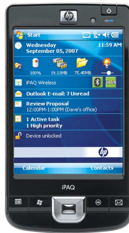
HP iPAQ 214