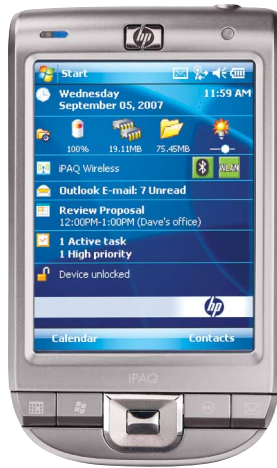
HP iPAQ 114