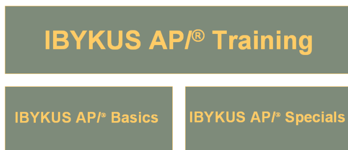
Abbildung 1: IBYKUS AP – Übersicht Trainingsbereiche

Aufgrund der Produktausprägung von IBYKUS AP gliedern sich die zu trainierenden Bereiche in zwei globale Blöcke: